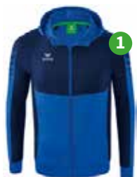
TRAININGSJACKE MIT KAPUZE